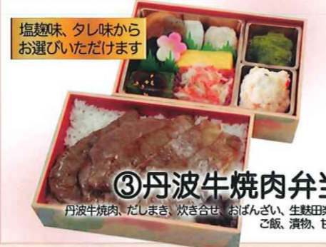
③丹波牛焼肉弁当 丹波牛焼肉、だしまき、炊き合せ、おぼんざい、生麩田楽、ご飯、漬物、甘味 塩麹味、タシ味からお選びいただけます