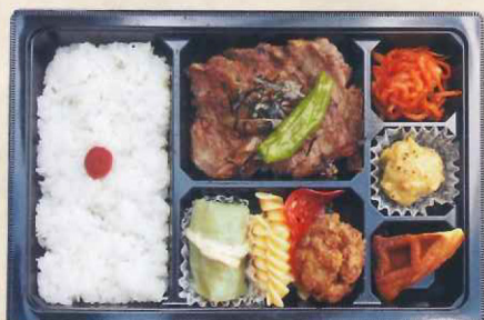
④5浅井食堂 手作りオニオンソースの 山盛りステーキ