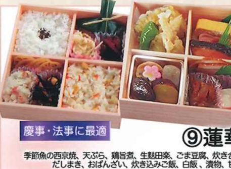
⑨蓮華 慶事・法事に最適 季節魚の西京焼、天ぷら、鶏旨煮、生麩田楽、ごま豆腐、炊き合せ、だしまき、おぼんざい、炊き込みご飯、白飯、漬物、甘味