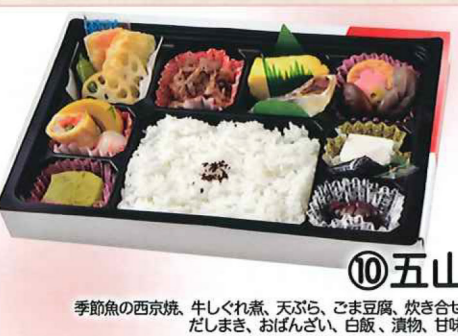
⑩五山 季節魚の西京焼、牛しぐれ煮、天ぷら、ごま豆腐、炊き合せ、だしまき、おぼんざい、白飯、漬物、甘味