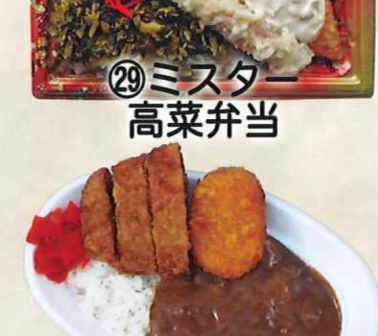
㉙ミスター 高菜弁当