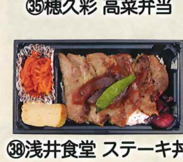
㉠浅井食堂 ステーキ弁