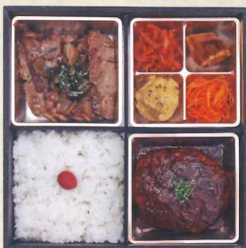
④3浅井食堂 ステーキ& ハンバーグ弁当