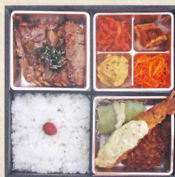
④4浅井食堂 ステーキ& ミックスフライ弁当