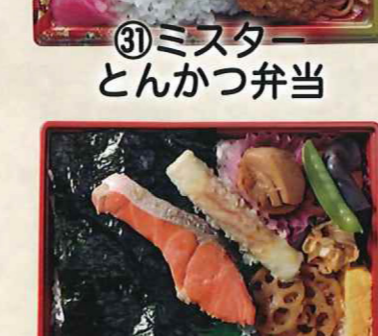
㉛ミスター とんかつ弁当