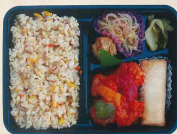
④9ハママラ エビチリ弁当