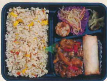
④8ハママラ 青椒肉絲弁当