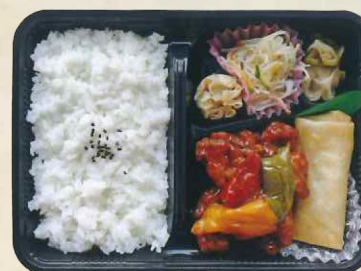
⑤0ハママラ 酢豚弁当