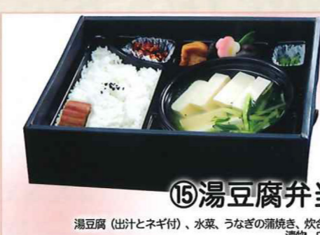
⑮湯豆腐弁当 湯豆腐(出汁とネギ付)、水菜、うなぎの蒲焼き、炊き合せ、漬物、白飯