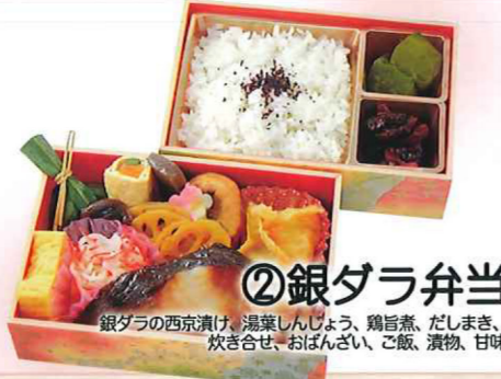
②銀ダラ弁当 銀ダラの西京漬、湯葉しんじょう、鶏旨煮、だしまき、炊き合せ、おぼんざい、ご飯、漬物、甘味