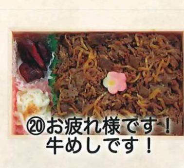
⑳お疲れ様です！ 牛めしです！