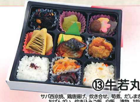
⑬牛若丸 サバ(西京焼)、鶏唐揚げ、炊き合せ、筍煮、だしまき、おぼんざい、炊き込みご飯、白飯、漬物、甘味