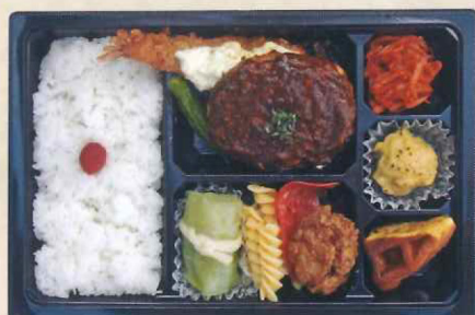
④6浅井食堂 浅井シェフの 欲張りデラックス弁当