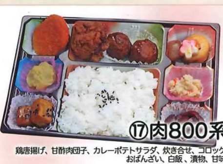
⑰肉800系 鶏唐揚げ、甘酢肉団子、カレーポテトサラダ、炊き合せ、コロック、おぼんざい、白飯、漬物、甘味