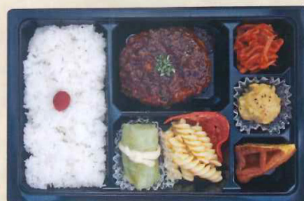
④7浅井食堂 手ごね粗挽きハンバーグ 熟成デミグラスソース