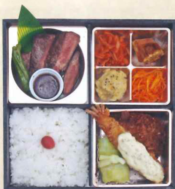
④0浅井食堂 和牛ステーキ& ミックスフライ弁当