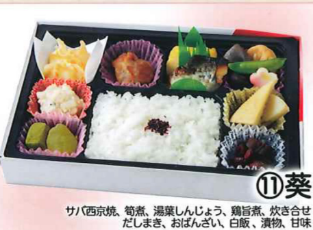
⑪葵 サバ西京焼、筍煮、湯葉しんじょう、鶏旨煮、炊き合せ、だしまき、おぼんざい、白飯、漬物、甘味