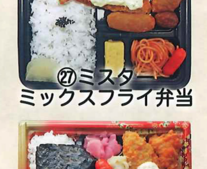
㉗ミスター ミックスフライ弁当