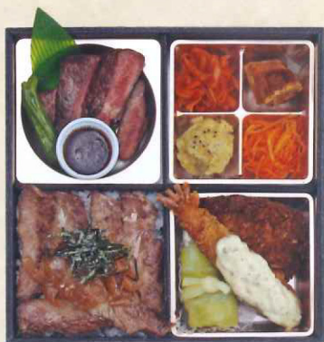
③9浅井食堂 ダブルステーキ弁当