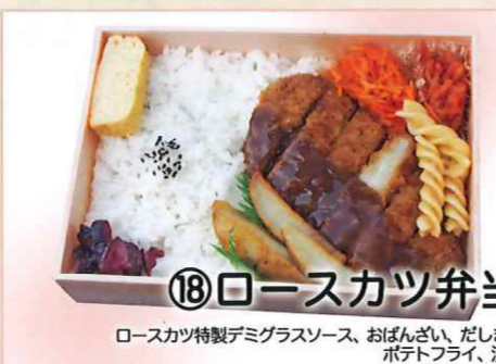
⑱ローズカツ弁当 ローズカツ特製デミグラスソース、おぼんざい、だしまき、ポテトフライ、漬物