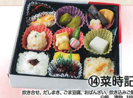
⑭菜時記 炊き合せ、だしまき、ごま豆腐、おぼんざい、炊き込みご飯、白飯、漬物、甘味