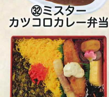
㉜ミスター カツコロカレー弁当