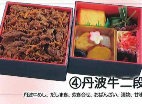
④丹波牛二段 丹波牛めし、だしまき、炊き合せ、おぼんざい、漬物、甘味