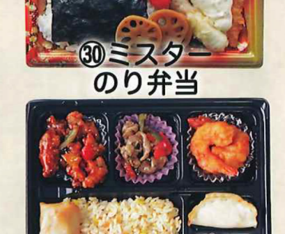
㉚ミスター のり弁当