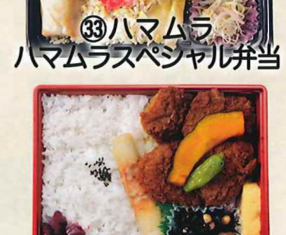
㉝ハムムラ ハムムラスペシャル弁当