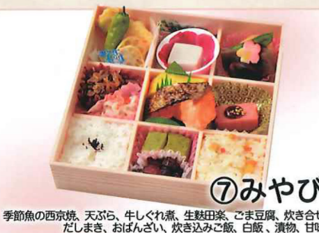
⑦みやび 季節魚の西京焼、天ぷら、牛しぐれ煮、生麩田楽、ごま豆腐、炊き合せ、だしまき、おぼんざい、炊き込みご飯、白飯、漬物、甘味