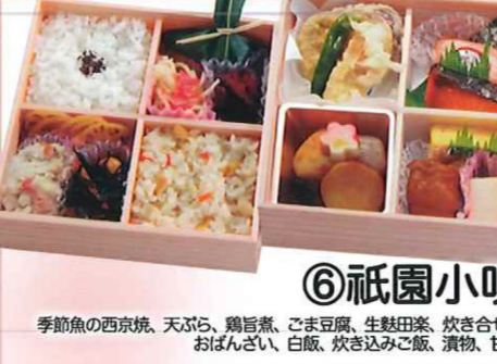
⑥祇園小唄 季節魚の西京焼、天ぷら、鶏旨煮、ごま豆腐、生麩田楽、炊き合せ、おぼんざい、白飯、炊き込みご飯、漬物、甘味