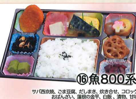
⑯魚800系 サバ西京焼、ごま豆腐、だしまき、炊き合せ、コロック、おぼんざい、蓮根の金平、白飯、漬物、甘味