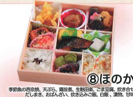
⑧ほのか 季節魚の西京焼、天ぷら、鶏旨煮、生麩田楽、ごま豆腐、炊き合せ、だしまき、おぼんざい、炊き込みご飯、白飯、漬物、甘味