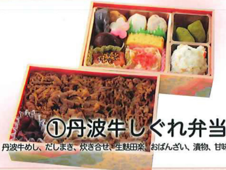
①丹波牛しぐれ弁当 丹波牛めし、だしまき、炊き合せ、生麩田楽、おぼんざい、漬物、甘味