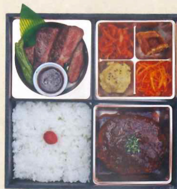
④1浅井食堂 和牛ステーキ& ハンバーグ弁当