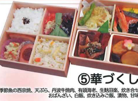
⑤華づくし 季節魚の西京焼、天ぷら、丹波牛焼肉、有節海老、生麩田楽、炊き合せ、おぼんざい、白飯、炊き込みご飯、漬物、甘味