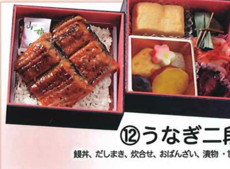
⑫うなぎ二段 鰻井、だしまき、炊き合せ、おぼんざい、漬物・甘味