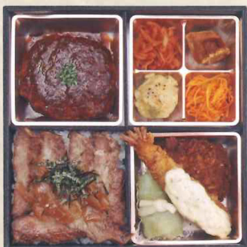
④2浅井食堂 浅井シェフの 欲張りロイヤル弁当