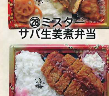
㉘ミスター サバ生姜煮弁当