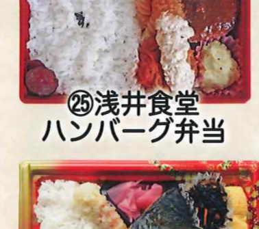
㉕浅井食堂 ハンバーグ弁当