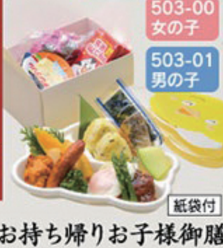
503-00 女の子 503-01 男の子