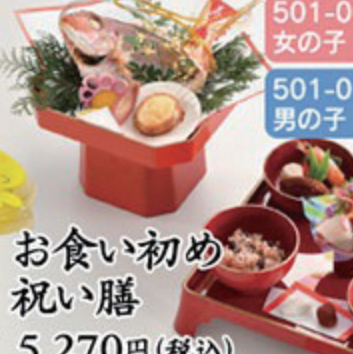
501-00 女の子 501-01 男の子