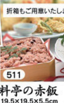
511 料亭の赤飯 2,380円(税込) 19.5×19.5×5.5cm