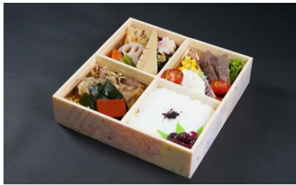
⑩ 近江牛すきやき&国産牛ステーキ弁当