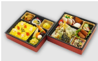
⑫ みなみの特選二段弁当 (極)