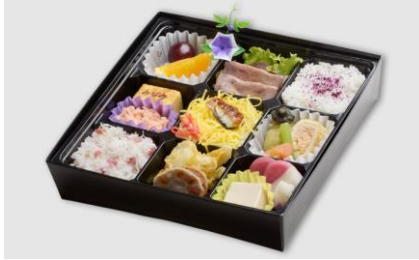
① 季節のにぎわい幕の内 (春・夏)

季節の商品は春・夏・秋によって内容の変更がございます。 時期により、注文できないこともございますのでご了承ください。 お写真の内容と異なる可能性がございますのでご了承ください。