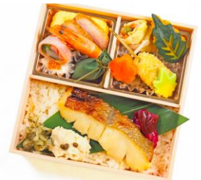
⑪ みなみの銀かれのいの西京焼き幕の内弁当