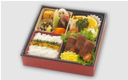
④ 国産ステーキ弁当