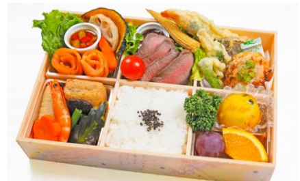
⑬ 近江牛ステーキ和洋折衷弁当