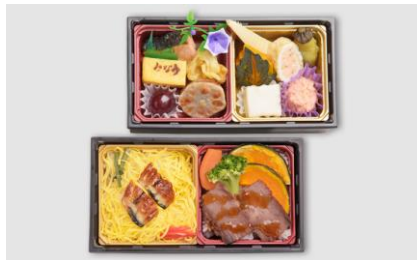
② 季節の二段かさね (夏・秋)