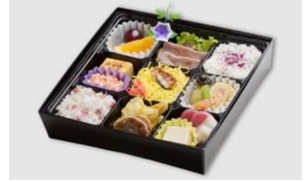
⑥ みなみのこだわり 幕の内 (冬)