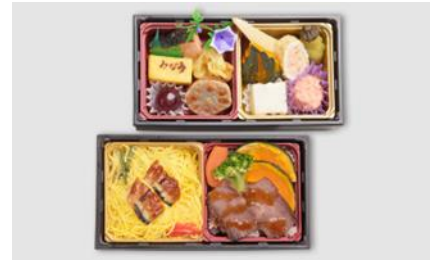
③ 季節の二段かさね (春)