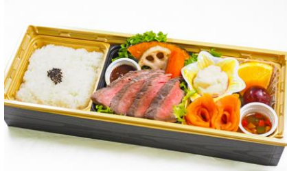
⑨ 近江牛ステーキとサーモンの洋食弁当