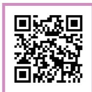
わんちゃんのご旅行

A 1～3 頭。施設によって異なります 頭数やネコの同伴については、施設によって異なります。リロホテルズ&リゾートの公式ホームページにてご案内しておりますのでご確認ください。 また、ポイントバケーションで発行しているワンちゃん登録カードのご提示、もしくは狂犬病、5 種以上の混合ワクチンの接種証明が必要です。忘れた場合は共有部のご利用ができません。予めご了承ください。