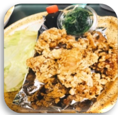
鶏唐揚げ 特製ねぎソース