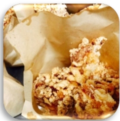
当店名物！鶏唐揚げ

〔 ☆ご注文数が多い場合はオードブルに盛り付ける事も可能です！ 〕 ※タレのかかった商品は一緒にできない場合があります