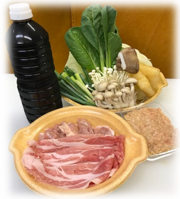
関取ちゃんこ鍋セット (大盛り一人前です) ←