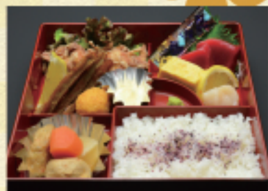
(31) ひょうたん弁当 1,300円*