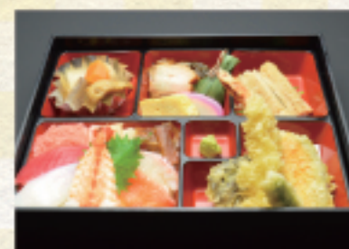
(33) ちらし弁当 2,200円*