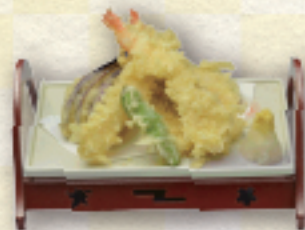
(40) 天ぷら盛合せ 1,650円