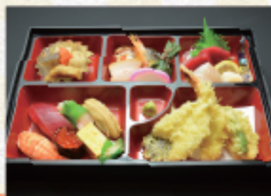
(34) にぎり寿司弁当 3,240円*