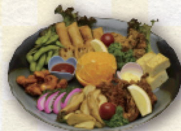
(41) 揚げ物盛合せ 1,500円より