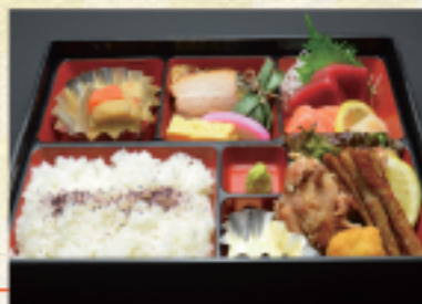
(32) 幕の内弁当 1,750円*