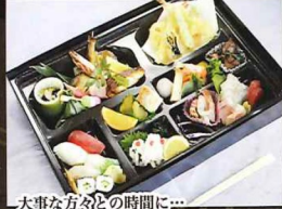
大事な方々の時間に...

17cm×11cm ◆ステーキ弁当 2,000円 (税込2,200円 [10%] / 2,160円 [8%])