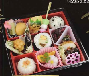
和の心を少しずつ...

27cm×18cm ◆こはる 1,350円 (税込1,485円 [10%] / 1,458円 [8%])