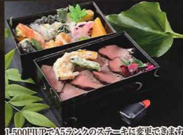
1,500円以上2,500円以下のステーキ等に復讐できます

27cm×18cm ◆ちらし弁当 1,800円 (税込1,980円 [10%] / 1,944円 [8%])