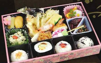
リーズナブルな価格で和を詰め込みました

12cm×12cm ◆みやび 2,000円 (税込2,200円 [10%] / 2,160円 [8%])