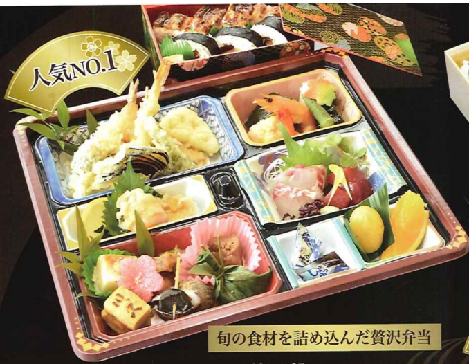
旬の食材を詰め込んだ贅沢弁当

32cm×27cm ◆お持ち帰り箱会席 3,200円 (税込3,520円 [10%] / 3,456円 [8%])