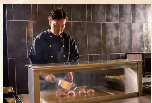
季節の食材をシェフが目の前で調理