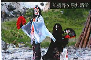
那須野ヶ原九尾堂