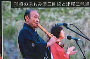
那須の湯も唄三味線と津軽三味線