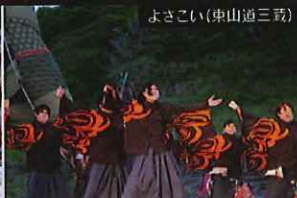
よさこい(中山道三鼓)